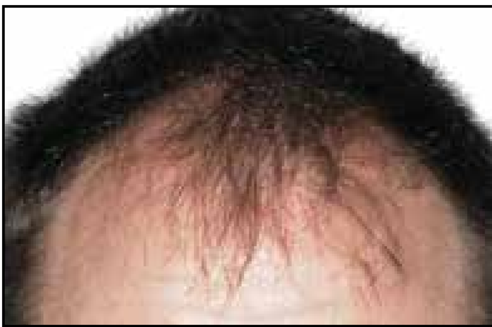
Línea de cabello antes del procedimiento

El crecimiento del cabello por lo general comienza alrededor del tercer y cuarto mes después del procedimiento. Usualmente, la mayor parte del crecimiento del cabello ocurre entre los 5 y 8 meses después del procedimiento, y el resto del crecimiento entre 8 y 12 meses. Esta es una guía en cuanto a crecimiento del cabello después del procedimiento. Hay algunos pacientes que experimentan todo el crecimiento rápidamente y otros que lo experimentan a partir del año o más tarde.