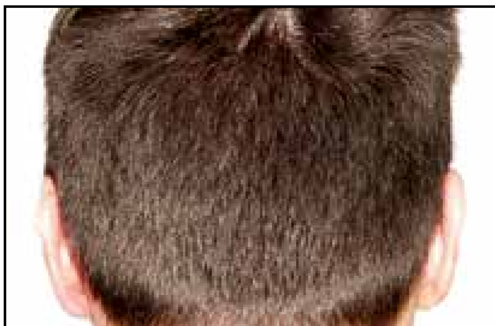
Área Donante - 9 meses después