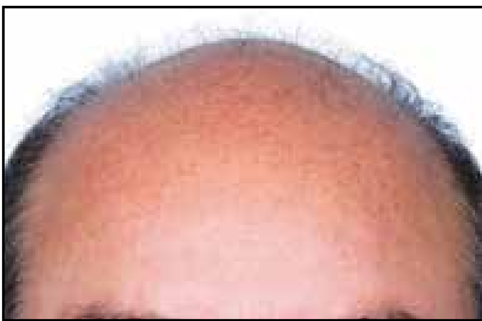
Línea de cabello antes del procedimiento