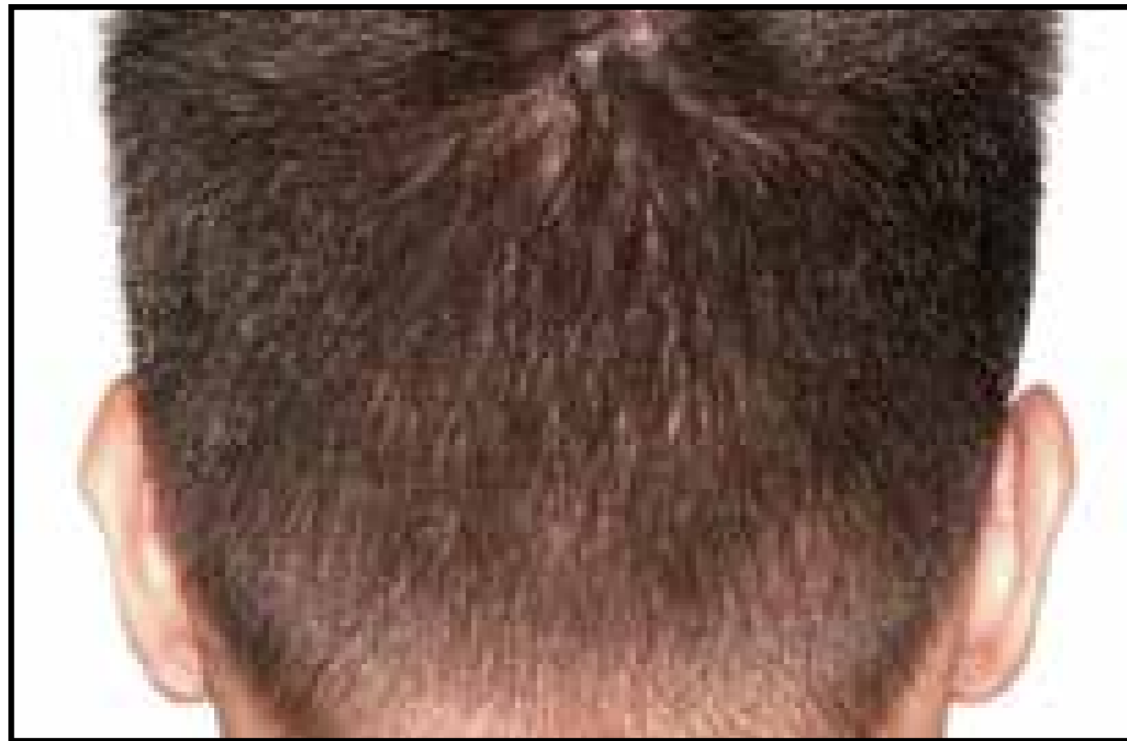
Área Donante - Antes del procedimiento