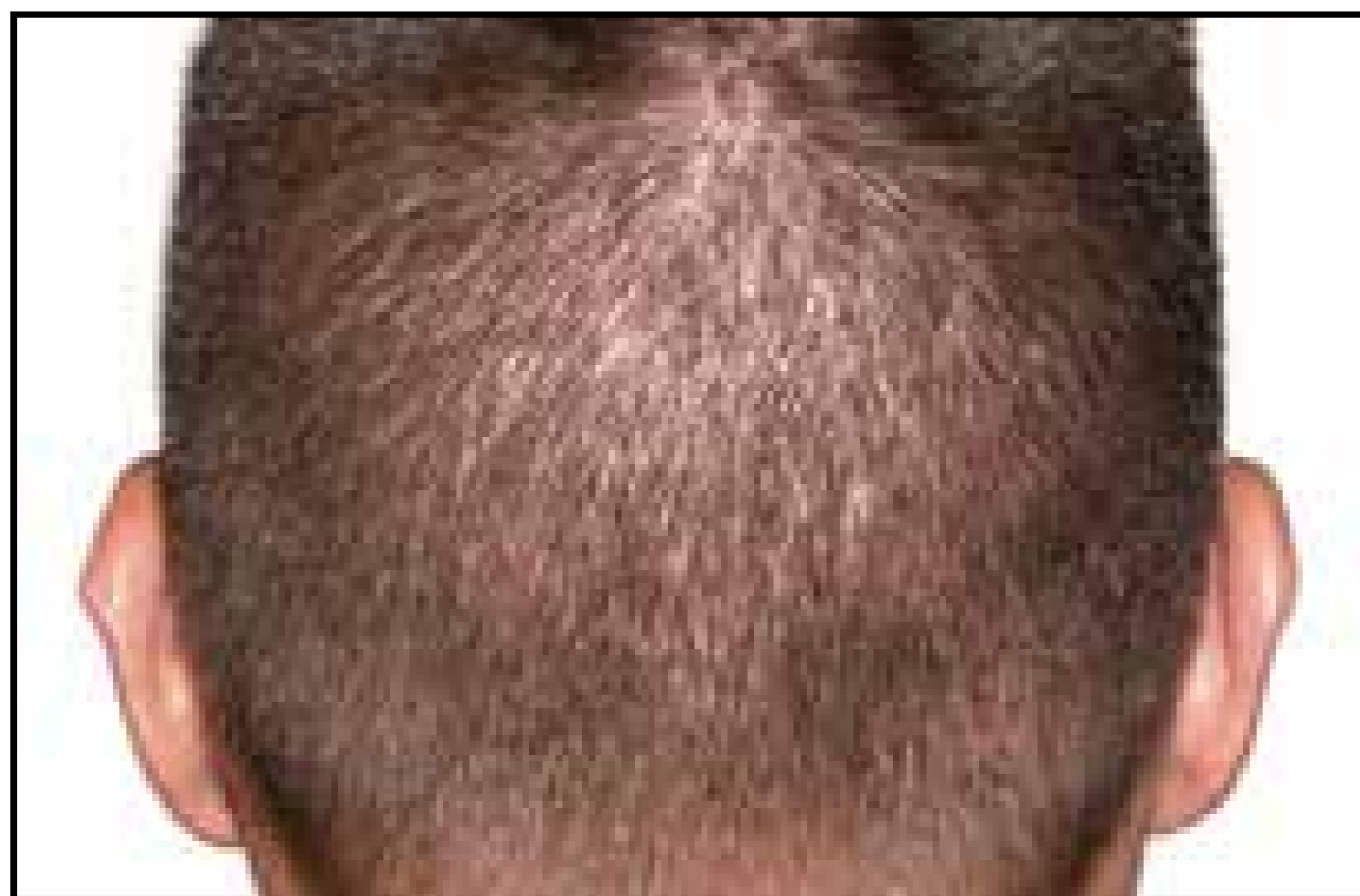
Área Donante - 1 semana después