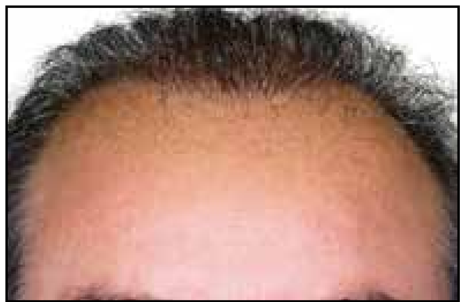
Línea del cabello 12 meses después

La precisión robótica y la experiencia de su médico ofrecen seguridad, resultados consistentes y de aspecto natural que se pueden disfrutar toda la vida.