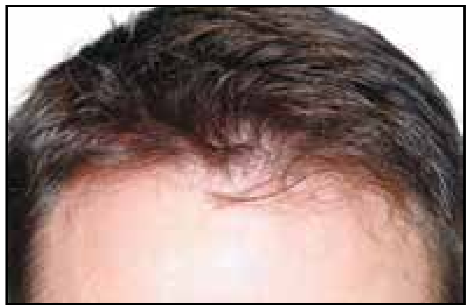
Línea del cabello 9 meses después